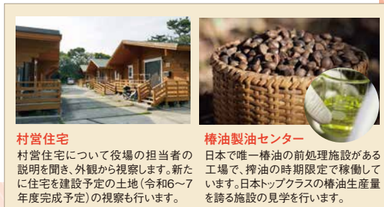
村営住宅 村営住宅について役場の担当者の説明を聞き、外観から視察します。新たに住宅を建設予定の土地(令和6~7年度完成予定)の視察も行います。 椿油製油センター 日本で唯一椿油の前処理施設がある工場、搾油の時期限定で稼働しています。日本トップクラスの椿油生産量を誇る施設の見学を行います。