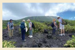
ガイドツアー(三原山) 先輩移住者であるガイドの方から、島の生活や移住体験談等の話を聞きつつ、総距離約2kmの火山体験ツアーに参加していただきます。