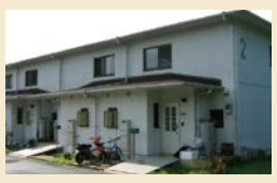
島内住宅施設見学 町役場の方から島の住宅事情についての説明を聞き、町営住宅を外観から紹介していただきます。