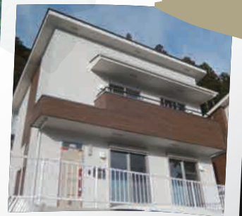
充実の子育て支援