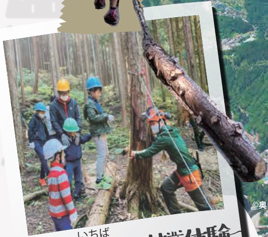
いちば「森と市庭」で林業体験