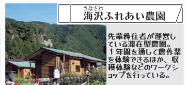
うなざわ 海沢ふれあい農園

奥多摩の歴史、水と自然の関係や、ダム仕組みについて学べる施設。3Dシアターで迫力満点の奥多摩を体験できます。