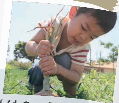
「ふれあい農園」で農園体験