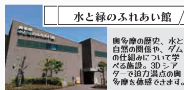
水と緑のふれあい館

東京都の最北西部に位置する日原にある木造宿泊施設のねねんぼう。奥多摩の中でも、特に山深い場所にあり、豊かな大自然を満喫できる。